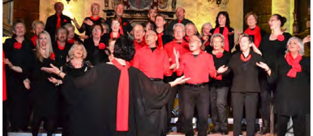
Rastede Gospel Choir (RGC)