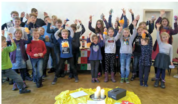
Teilnehmende an der Kinderkirche