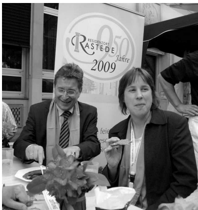
„Rasteder Krafftecke“

Den Beifall der Menge erwiderte der Bischof, indem er den Umstehenden auch Beifall klatschte. Dann ließ er sich auf einer Bank nieder und stärkte sich an einem Schwarzbrot mit Mettwurst, dargeboten als „Rasteder Krafftecke“.