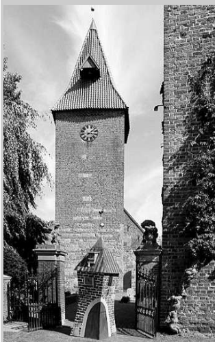
2x St. Ulrich