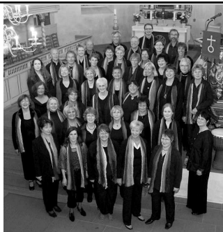
Holy Night Singers (privat)